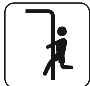
Barra de bomberos