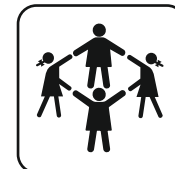
Capacidad 6-10 niños