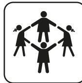
Capacidad 1-20 uds.