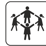
Capacidad 6-8 uds.